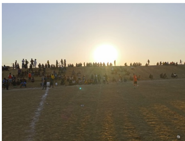
Torcida fiel com um sol de 43°C