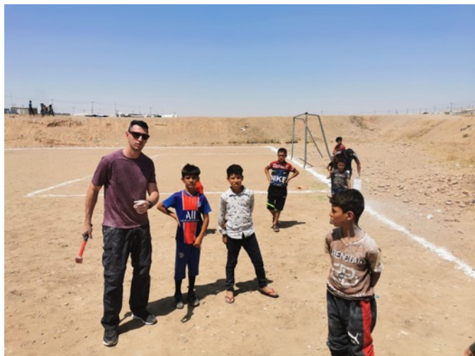
Melhorias no Campo de Futebol