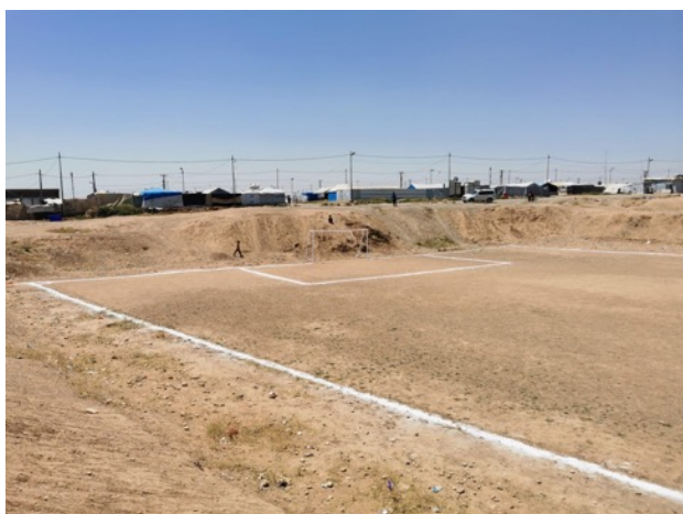
Campo após melhorias