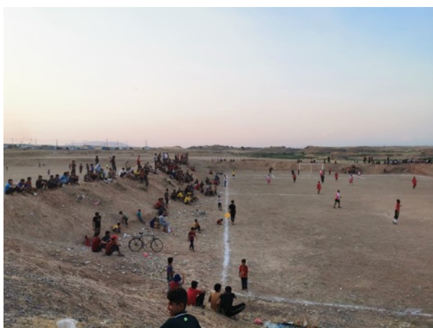
Torcida acompanhando o jogo