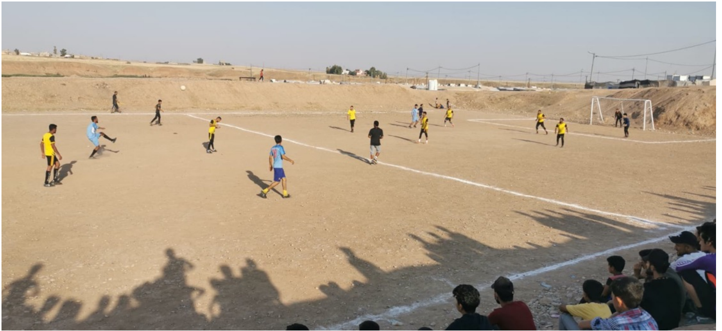
Jogo muito disputado!